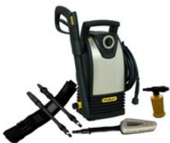
Lavadoras eléctricas de alta presión