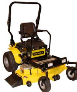
Cortadoras comerciales de césped de giro cerrado