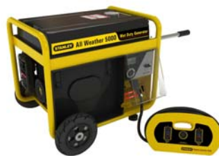
Generadores a gasolina