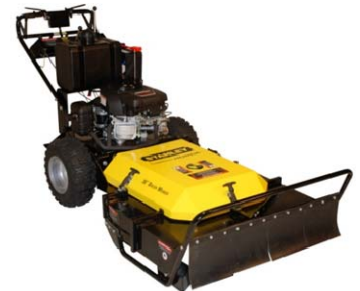
Cortadoras de césped y maleza, guiada a pie